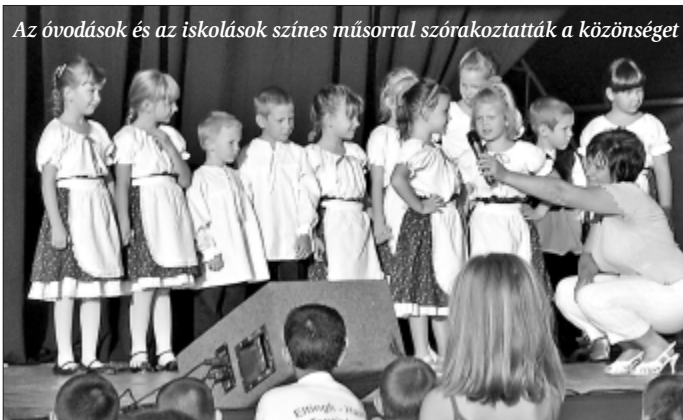
Az óvodások és az iskolások színes műsorral szórakoztatták a közönséget