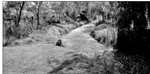
Megtisztult a „Pityó” vízlevezető csatorna