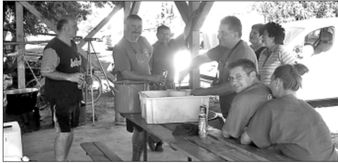
Nagyszerű hangulatú, igazi vízparti nyárvégi nap volt