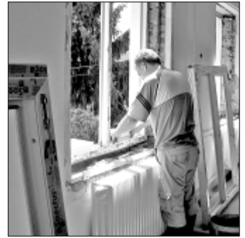
A nyílászárókat korszerű műanyag és hőszigetelt ablakokra cserélték

A fél falu átszelő ún. „Pityó” víz-elvezető csatorna tisztítása akut probléma falunkban. A terület gazdája a Dél-Pest Megyei Vízgazdálkodási Társulat, akik nem sok odafigyelést tanúsítottak az elmúlt évek alatt. A vízlevezetőt benőtte a nád és egyéb gyomnövény. Az eliszaposodott medret számos más lakossági hulladék is terheli. Az alapos gépi kotrásnak számos akadálya van, melynek elhárítása korántsem egyszerű feladat. Nyáron – a vízfolyás biztosítására illetve javítására – önkormányzatunk kezdeményezésére a Vízgazdálkodási Társulat emberi levágták a nádat. A vegyszeres nád és gyomirtással egy erre szakosodott vállalkozót bízott meg a társulat. A költségekhez önkormányza-