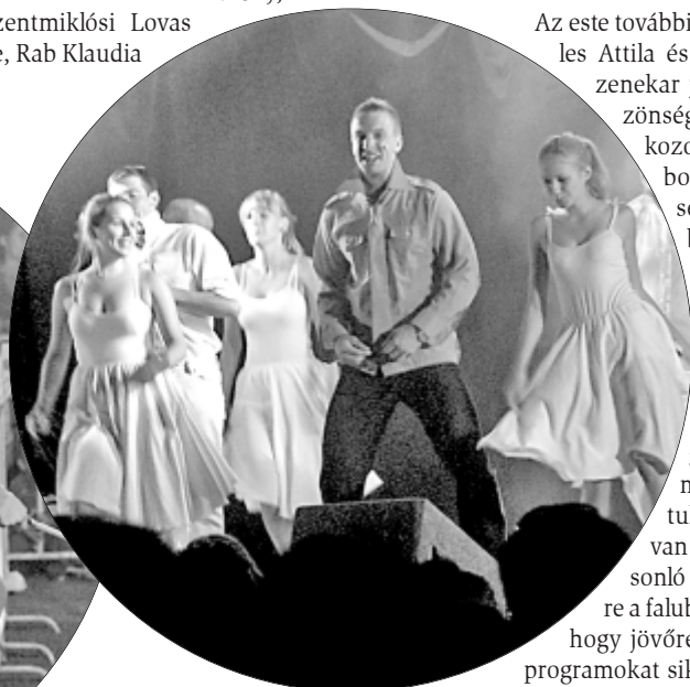
A Made in Hungaria előadása egyszerűen elbűvölte a tószegi közönséget