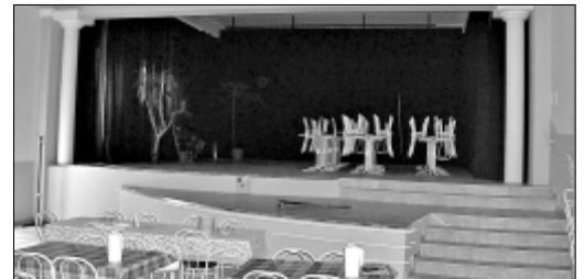
Megújult a Művelődési Ház nagytermének színpada is