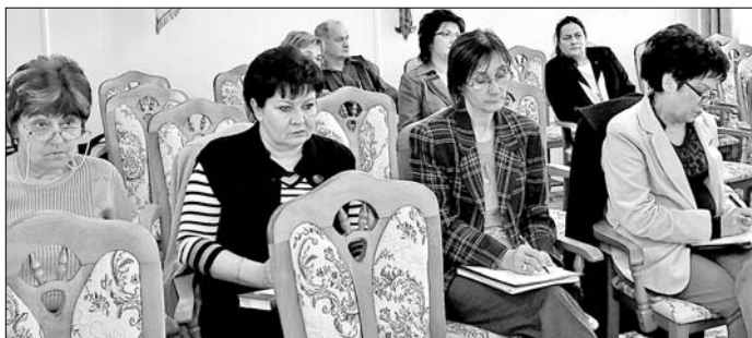
Érdeklődve hallgatták az intézményvezetők a tájékoztatót