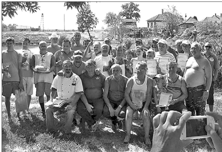
A verseny sok embert csalt ki a közsé- gi horgász tóra

Az eredményhirdetés után nem kellett nagyon invitálni senkit az elkészült finomságok elfogyasztá- sára. Nem is maradt senki éhesen.