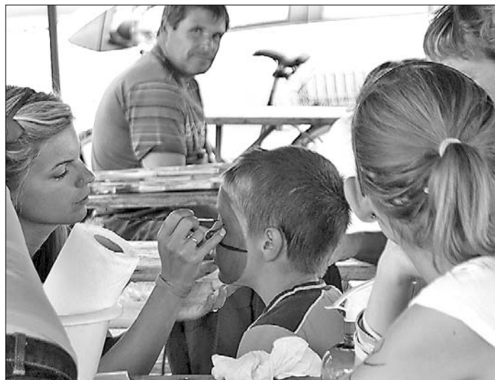
A gyerekeket arcfestéssel is várták

számmal közel fél százan akadtak jelentkezők a versenyre.