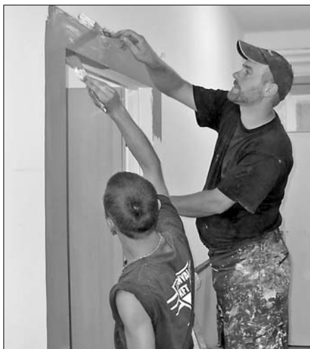
Az óvoda 2010-es felújítása