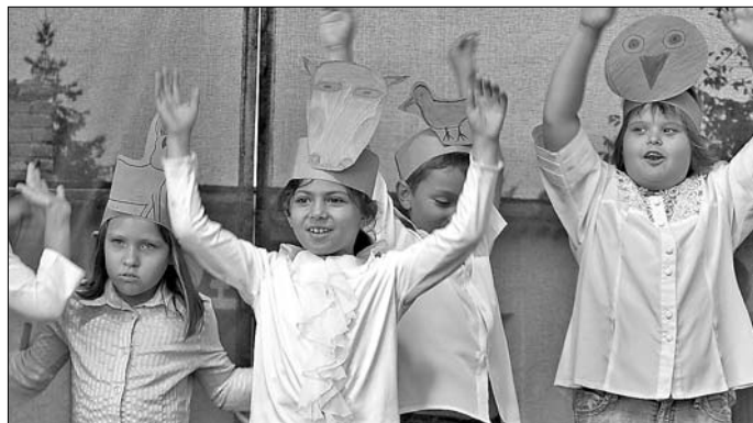
A legkisebbek zárták a színpadi fellépések sorát

Az est folytatásaként 20 órától az Irigy Hónaljmirigy show műsora szórakoztatta a jelenlévőket. A majd' egy órás műsort a közönség szinte végigtombolta, fergeteges hangulatot varázsoltak a televízióból jól ismert