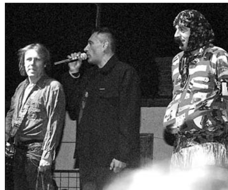
Este az Irigy Hónaljmirigy lépett fel

művészek. 21 óra körül fellőtték az első tűzijátékot, melyet a közönség szintén nagy örömmel fogadott.