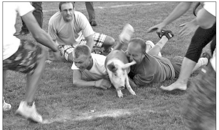
Idén sem maradt el a közönség körében közkedvelt malacfogó verseny