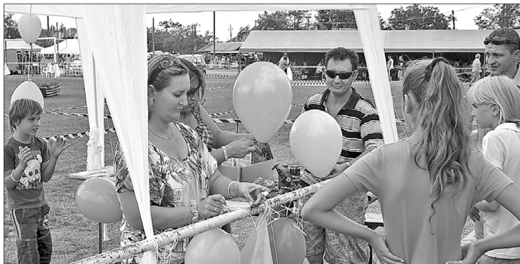
Örömmel vették birtokba a gyermekek a játszóházakat, a légvárat, majd kézműves foglalkozásokon is részt vehettek