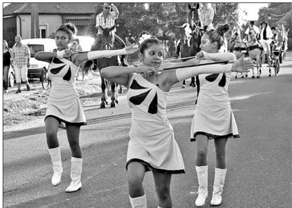
Mazsorettek nyitották meg a rendezvényt