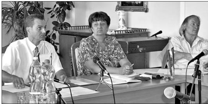
Szeptember 12-én tartotta soros ülését a képviselő-testület