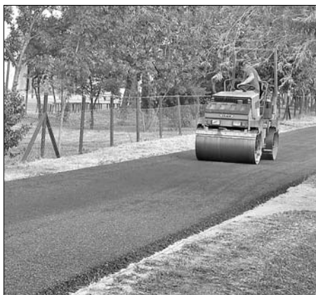
A leterített aszfalt hengerezése