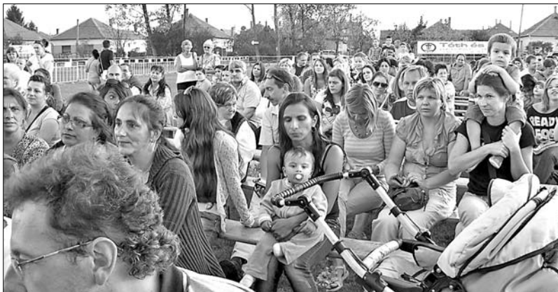
Jól szórakozott az iskolások műsorán a közönség