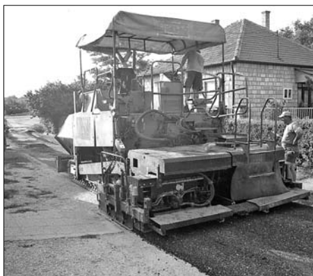
Az aszfaltot finisher teríti