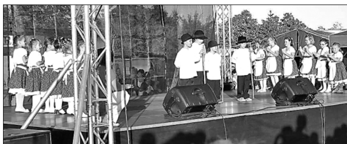
Az óvodás néptáncscsoport fellépett a falunapon is

ket szerezhethetnek. A játékokat és a feladatokat a leghatékonyabban módon szereteti meg a gyermekekkel, közösen együttjátsszik velük. Segíti a gyermekeket, ha azt látják, hogy számára is örömet okoz a zene, tánc, és amit valójában elvár tőlük észrevétlenül mintaadás során elsajátítják akár a párválasztókban, ugrálós feladatokban. A foglalkozások elmaradhatatlan része a szab-