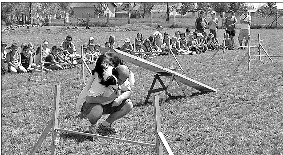
A Bóbic Lovasudvar gazdag programot kínál: őshonos állatok bemutatása, látványtetése, ápolása, íjászat megismertetése, kipróbáltatása, kutyás agility bemutató

Gratulálunk a civil szervezetnek, amely talán elsőként falunkban, felfedezte az önkéntes közösségek fő feladatát. Munkájuk nem csak a faluközösség, hanem a gyermeknevelés fejlődését is szolgálja. Segítsünk munkájukat!