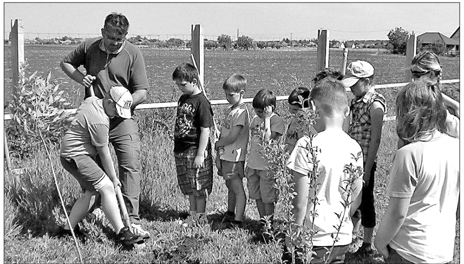
A szolnoki Tiszaparti Általános Iskola tanulói faültetésen is részt vettek

bi programokkal is: őshonos állatok bemutatása, látványtetése, ápolása, íjászat megismertetése, kipróbáltatása, kutyás agility bemutató, és faültetés. Júniusban négy községből közel nyolcvan fő, 8 és 14 év közötti gyermek érkezett Katáékhoz. Korosztálynak megfelelően készítették a napirendet: hagyományos vetélkedők, állatok megismertetése, lovaglás, íjászat. Júliusban nomád gyermektábort szerveztek 15 fővel, hétfőtől péntekig, reggel 8 órától 16 óráig. Az őshonos állatok bemutatásán, etetésén, gondozásán kívül a gyermekek részt vehettek rendkívü-