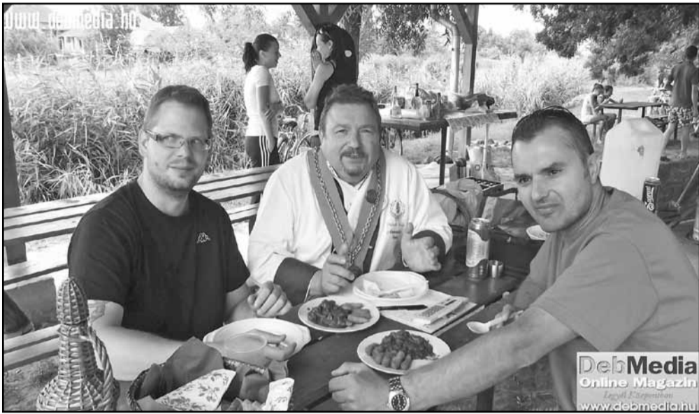
A főzőverseny zsűrije

Bár még tart a horgász évad a Tószegi Tiszavirág Horgász Egyesületben, már most elmondhatjuk eredményes, tervszerű élet jellemezte az elmúlt hónapokat. Ezt szemléletesen alátámasztja ha megnézzük a versenynaptár adatait, amely jól mutatja milyen sokrétű programokból válogathattak az érdeklődők, többnyire falubeliek.